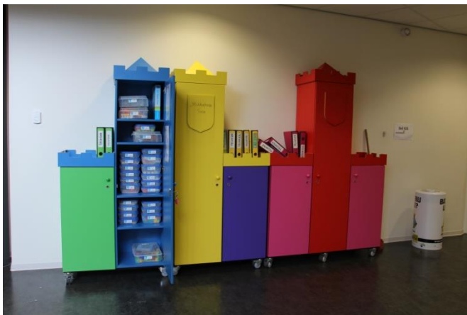
Blauwe toren is voor onderbouw

De techniektorens staan in de centrale hal van het Rajubibos.