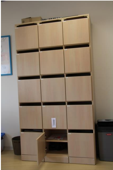
Kast met technieksleutel

De sleutel van de techniektorens liggen op de eerste verdieping in de personeelskamer (onderin middelste vak) .